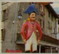
C'est Jacquemard qui accueille symboliquement les nouveaux habitants.

Il est à Taninges, une tradition ancestrale que l'office de tourisme et la municipalité tiennent à perpétuer : il s'agit du "Baptême Jacquemard". Lundi 21 juin, jour de la fête de la musique, les habitants de Taninges sont conviés à se rassembler sur la place du village pour assister au "Baptême Jacquemard", qui consiste à accueillir officiellement des personnes qui ne sont pas de Taninges, mais qui vivent dans la commune depuis plus d'un an. La cérémonie aura lieu au pied des escaliers de la Montée du Char. À 19 heures, Jacquemard arrivera sur la