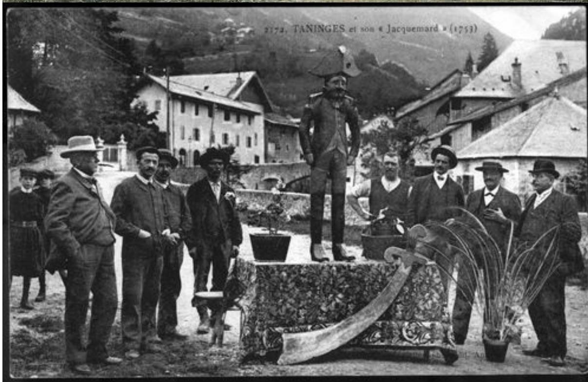
Photos du début du XXème siècle